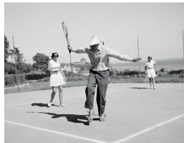
Le cours de tennis... The tennis court...