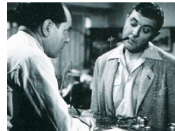
Hôtel de la Plage (intérieurs filmés dans des décors, studios de Boulogne-Billancourt). Monsieur Hulot décline son identité : «H.U.L.O.T» Mr Hulot spells his name at the hotel reception. The scene was shot at Boulogne Billancourt studios.