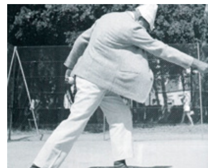
... où M. Hulot exécute son fameux service. ... where Mr Hulot makes his famous service.