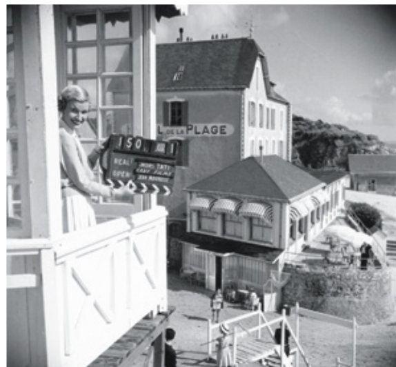
Une fausse entrée a été ajoutée à l'Hôtel de la Plage. A fake entrance was added to the hotel.