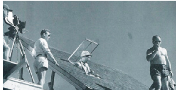
La chambre de Monsieur Hulot: l'envers du décor Behind the scene: Mr Hulot's bedroom