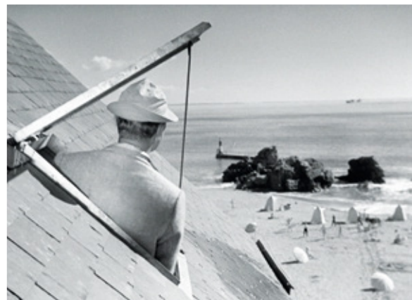
Tournage en extérieur, été 1951. Jacques Tati a fait dresser un phare à l'extrémité de la jetée. J. Tati had a light-house erected at the end of the pier.