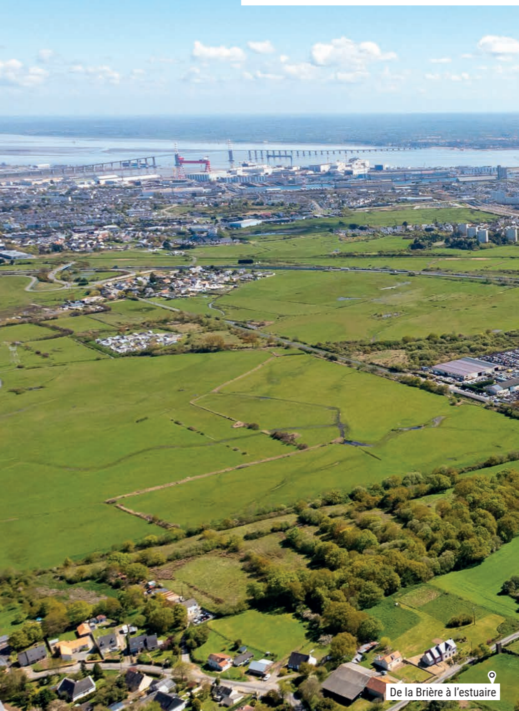
De la Brière à l'estuaire

Premier port de la façade atlantique française, 2 e pôle aéronautique en France, berceau de la construction navale, pionnière en matière d'énergies marines renouvelables... Saint-Nazaire est reconnue dans le monde entier pour ses savoir-faire industriels d'exception, tournés vers les enjeux environnementaux de demain.