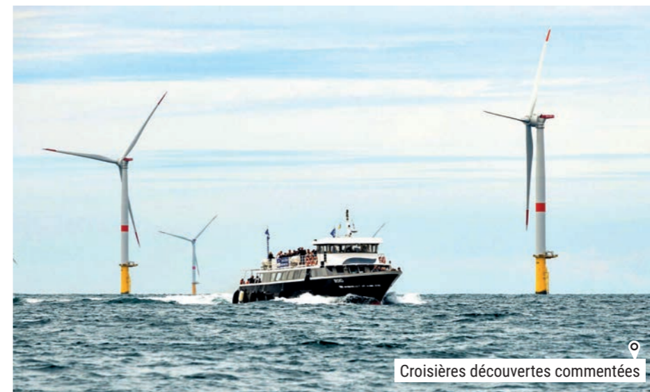
o Croisières découvertes commentées