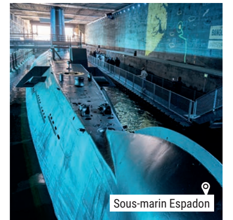
o Sous-marin Espadon