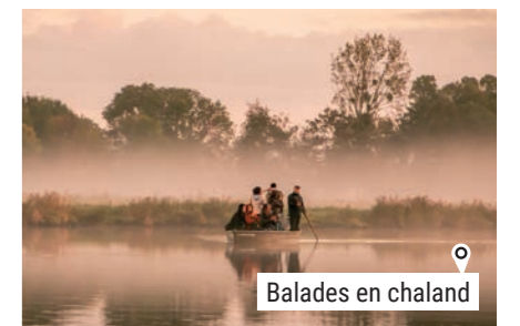
o Balades en chaland