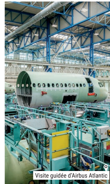
o Visite guidée d'Airbus Atlantic