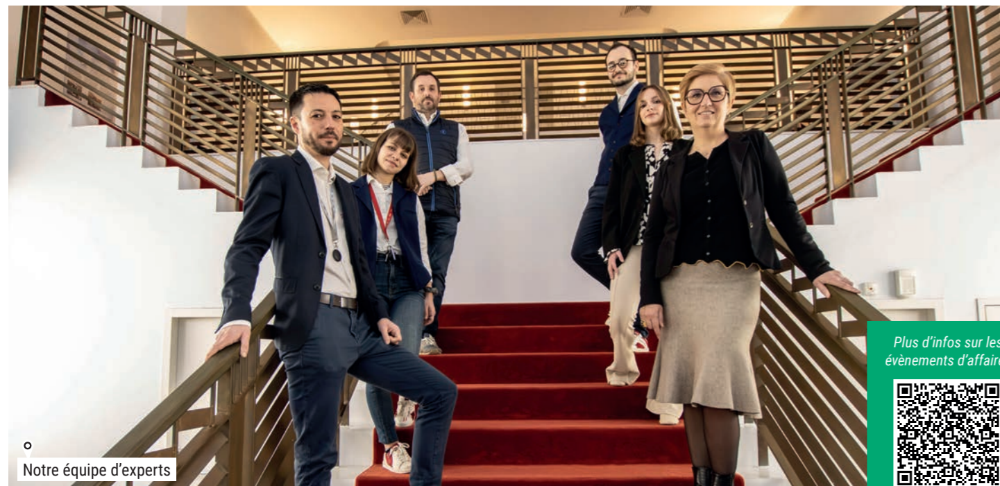
o Notre équipe d'experts

Plus d'infos sur les événements d'affaires