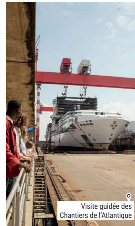
o Visite guidée des Chantiers de l'Atlantique