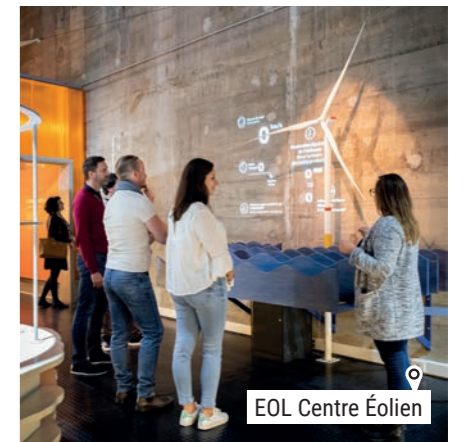
o EOL Centre Éolien